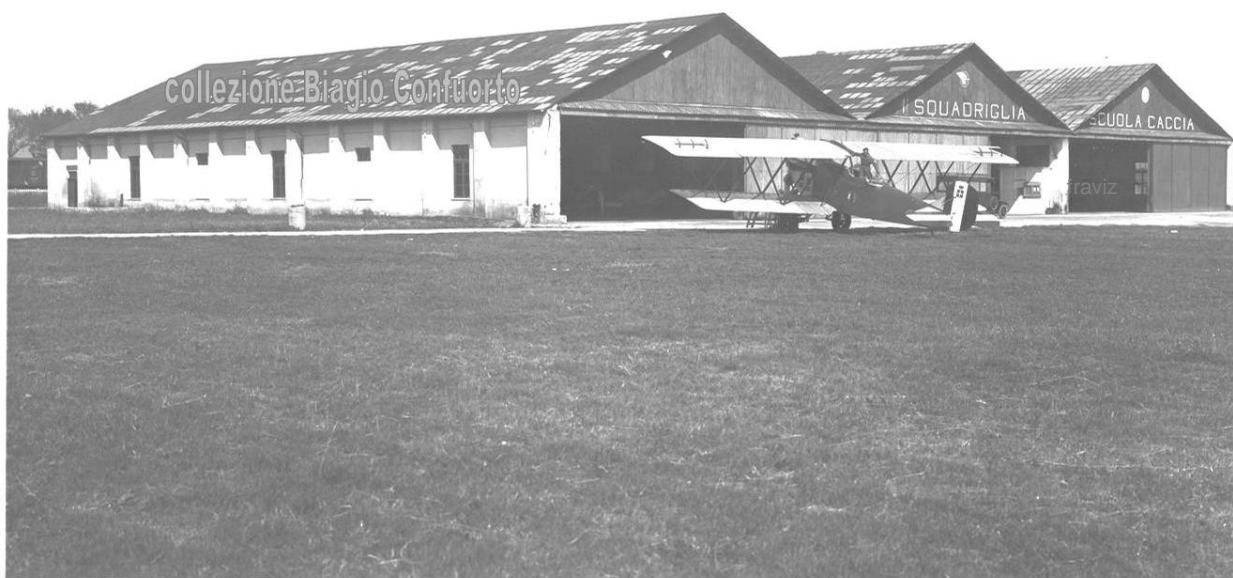
Campo di Aviazione Furbara - Hangar, 1924

L'aeroporto di Furbara si estende su una superficie pianeggiante di circa 200 ettari.