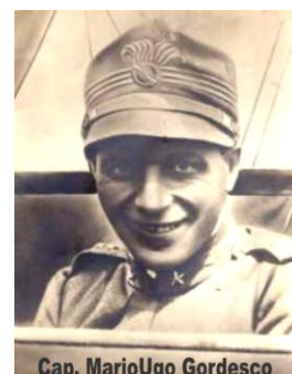
Cap. MarioUgo Gordesco

Nel 1920 Furbara diviene sede della prima pattuglia acrobatica. L'aeroporto è dedicato proprio a " Mario Ugo Gordesco " capitano del Regio Esercito Italiano e comandante della 1 a pattuglia acrobatica a Furbara.