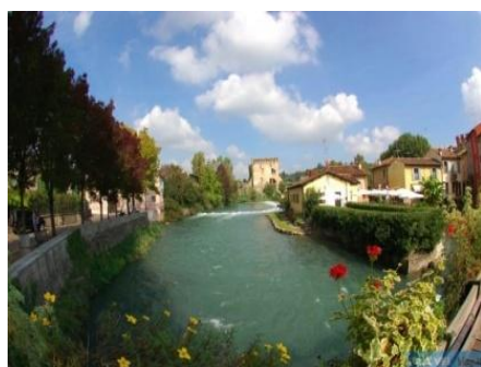
Valeggio sul Mincio Borghetto