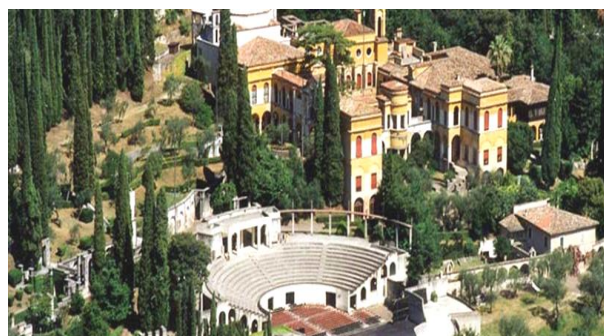
Gardone Riviera. Il Vittoriale di D'Annunzio