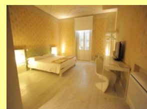
A Mantova Hotel Pensione completa