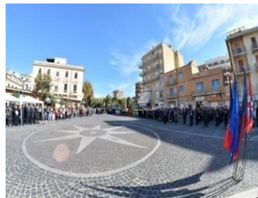
5 e 6 Novembre. Ladispoli. Festa dell'Unità d'Italia e Giornata delle FF.AA..