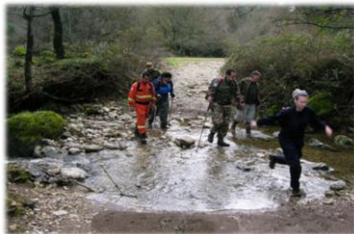
21-26 Novembre. La Sezione svolge un corso di Orientamento e Topografia per 30 operatori di Fare Ambiente della Protezione civile di Cerveteri, condotto da Socio istruttore, qualificato Aerosoccorritore,